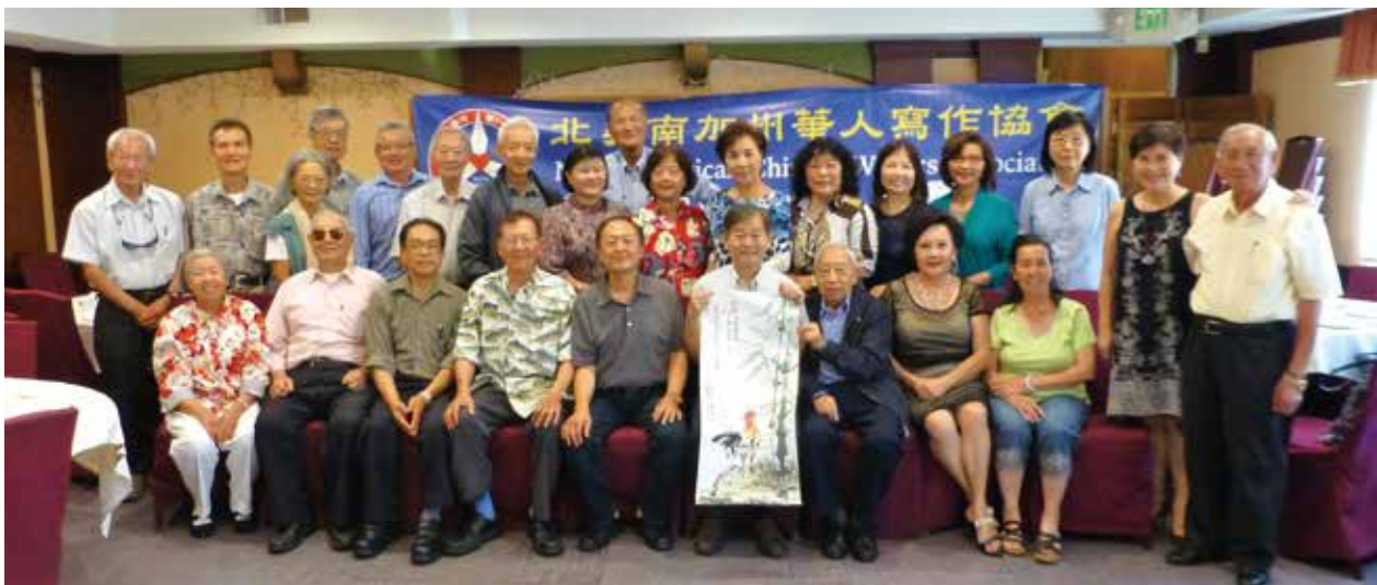
↑第16屆監事選出後，大家合影留念。

北美華文作家協會總會會長吳宗錦介紹，同於一九九一年成立的北美華文作家協會與南美華文作家協會，都隸屬於世界華文作家協會分佈全球各洲的七大主會之一。其中，北美華文作家協會（包含加拿