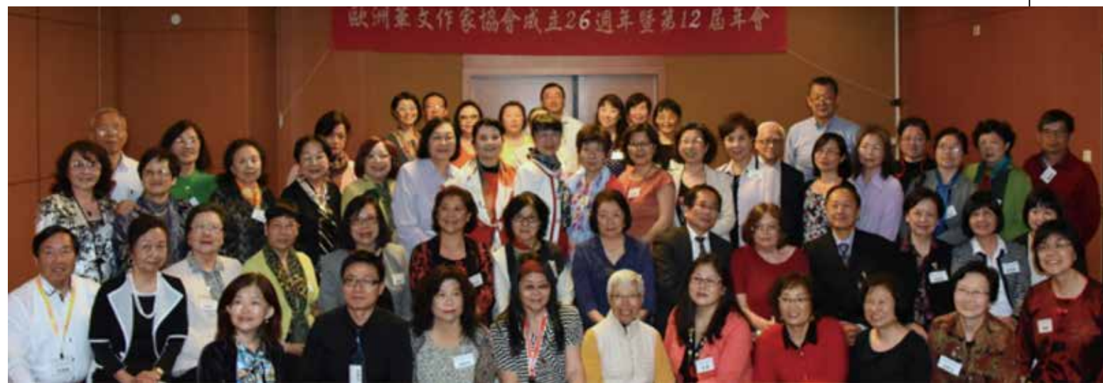
↑出席歐華作協華沙大會全體作家合影。