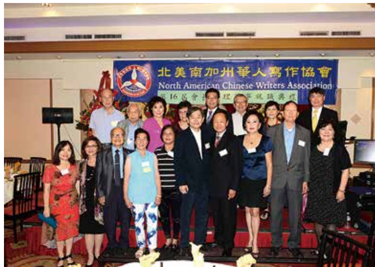
↑本會第16屆會長和理監事就職典禮後大合照。

南加州地區的主要媒體世界日報等報紙網站，都派記者前來實況報導。八月雅敘會於下午三點多，在全場高歌「中華民族頌」中圓滿畫下句點。 【北美南加州作協秘書長／廖貞靜撰文報導】