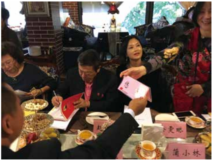
↑在座談會中，大家互相交換自己的著作。