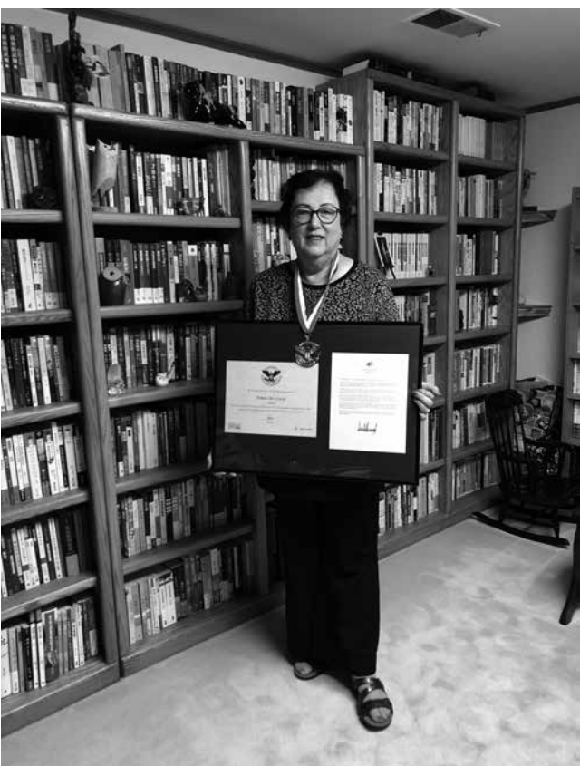
↑韓秀獲得白宮頒發的2020年度「總統獎」金獎。